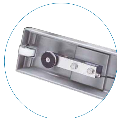
Ruedas de transporte